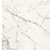
KM24 Invisible opaco