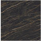
KM07 Portoro opaco